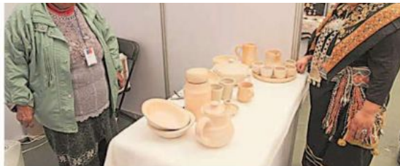
LA EXPO INTERCULTURAL MAPUCHE CONSIDERÓ 30 STANDS.

Y agregó: "Acá hubo muchas cosas hechas con cariño, que aportan a la economía de las familias. También se aprovechó la oportunidad para generar nuevas redes de colaboración y